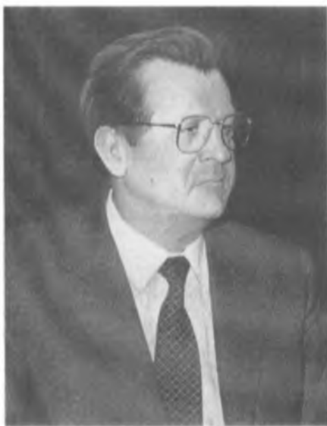
ВОРОТНИКОВ Виталий Иванович

Член Политбюро ЦК КПСС, заместитель Председателя Президиума Верховного Совета СССР, Председатель Президиума Верховного Совета РСФСР. Родился 20 января 1926 года в городе Воронеже. Русский. В 1954 году окончил Куйбышевский авиационный институт. Член КПСС с 1947 года.