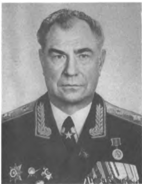
ЯРОВ Дмитрий Тимофеевич