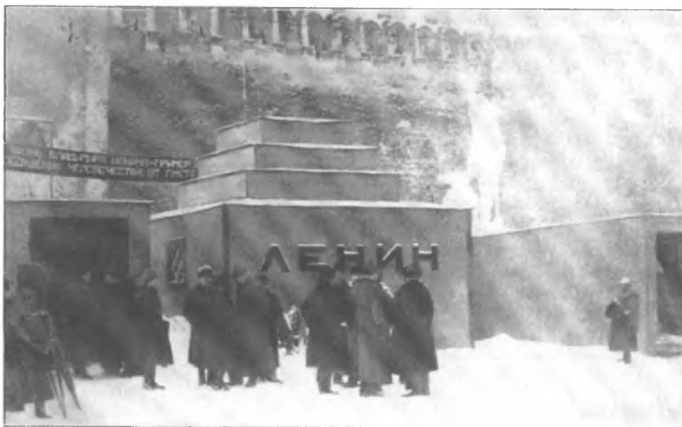
Первый, временный Мавзолей В. И. Ленина. Архитектор А. В. Щусев. 1924 г. По проекту А. В. Щусева летом 1924 г. был сооружен деревянный Мавзолей, а в 1930 г. — нынешний Мавзолей, облицованный гранитом.