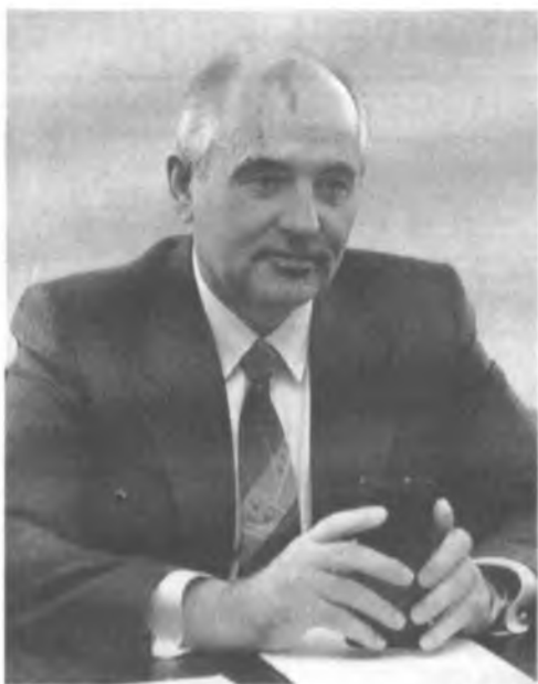
ГОРБАЧЕВ Михаил Сергеевич

Генеральный секретарь ЦК КПСС, Председатель Президиума Верховного Совета СССР. Родился 2 марта 1931 года в селе Привольном Красногвардейского района Ставропольского края в семье крестьянина. Русский. В 1955 году окончил юридический факультет Московского государственного университета имени М. В. Ломоносова, в 1967 году — Ставропольский сельскохозяйственный институт. Член КПСС с 1952 года.