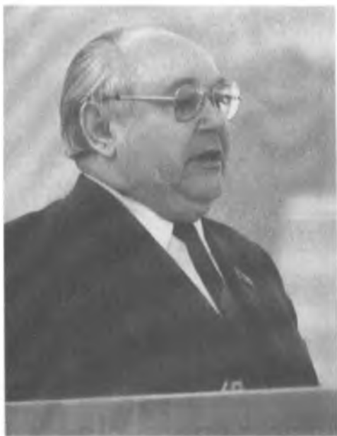
НИКОНОВ Виктор Петрович

Член Политбюро ЦК КПСС, секретарь ЦК КПСС. Родился 28 февраля 1929 года на хуторе Белогорка Вешенского района Ростовской области. Русский. В 1950 году окончил Азово-Черноморский сельскохозяйственный институт. Член КПСС с 1954 года.