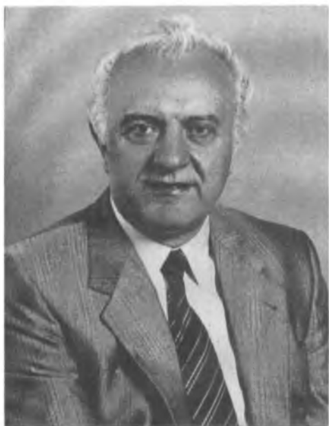
ШЕВАРДНАДЗЕ Эдуард Амвросиевич

Член Политбюро ЦК КПСС, министр иностранных дел СССР. Родился 25 января 1928 года в селе Мамати Ланчхутского района Грузинской ССР. Грузин. В 1959 году окончил Кутаисский государственный педагогический институт имени А. Цулукидзе, в 1951 году партийную школу при ЦК Компартии Грузии. Член КПСС с 1948 года.