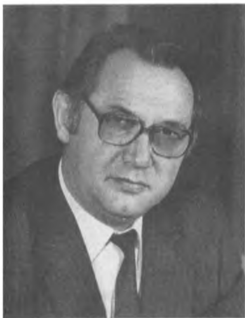
МАСЛЮКОВ Юрий Дмитриевич

Кандидат в члены Политбюро ЦК КПСС, первый заместитель Председателя Совета Министров СССР, председатель Государственного планового комитета СССР. Родился 30 сентября 1937 года в городе Ленинабаде Таджикской ССР Русский. В 1962 году окончил Ленинградский механический институт. Член КПСС с 1966 года.