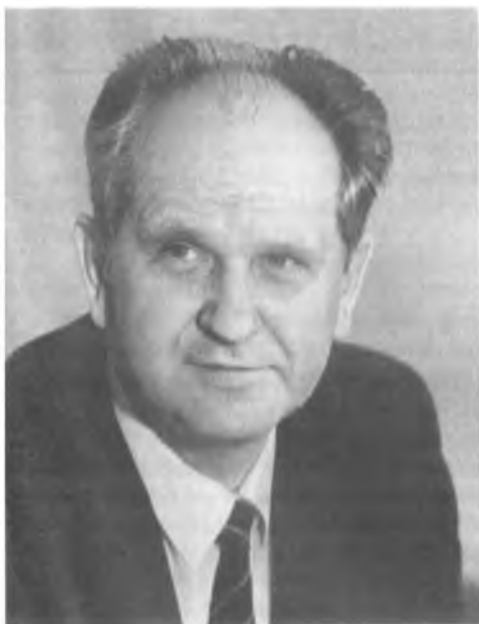
ПУГО Борис Карлович

Председатель Комитета партийного контроля при ЦК КПСС. Родился 19 февраля 1937 года в городе Калинин. Латыш. В 1960 году окончил Рижский политехнический институт. Член КПСС с 1963 года.