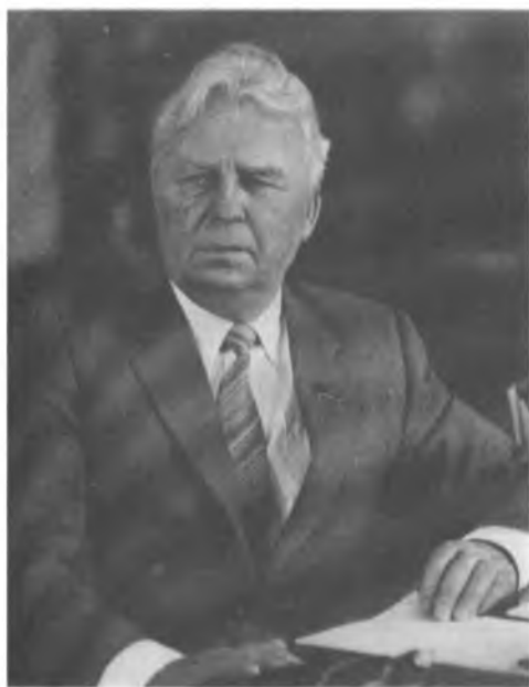
ЛИГАЧЕВ Егор Кузьмич

Член Политбюро ЦК КПСС, секретарь ЦК КПСС. Родился 29 ноября 1920 года в деревне Дубинкино Чулымского района Новосибирской области. Русский. В 1943 году окончил Московский авиационный институт имени С. Орджоникидзе, в 1951 году — Высшую партийную школу при ЦК ВКП(б). Член КПСС с 1944 года.