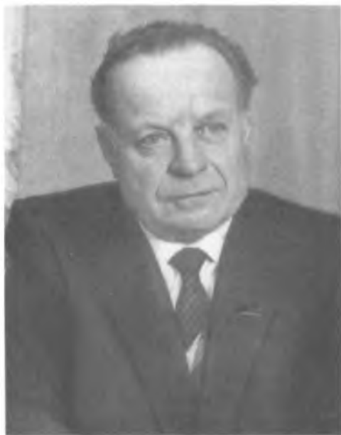
ЗАЙКОВ Лев Николаевич

Член Политбюро ЦК КПСС, секретарь ЦК КПСС, первый секретарь Московского горкома КПСС. Родился 3 апреля 1923 года в городе Туле. Русский. В 1952 году окончил Ленинградский электромеханический техникум, в 1963 году — Ленинградский инженерно-экономический институт. Член КПСС с 1957 года.