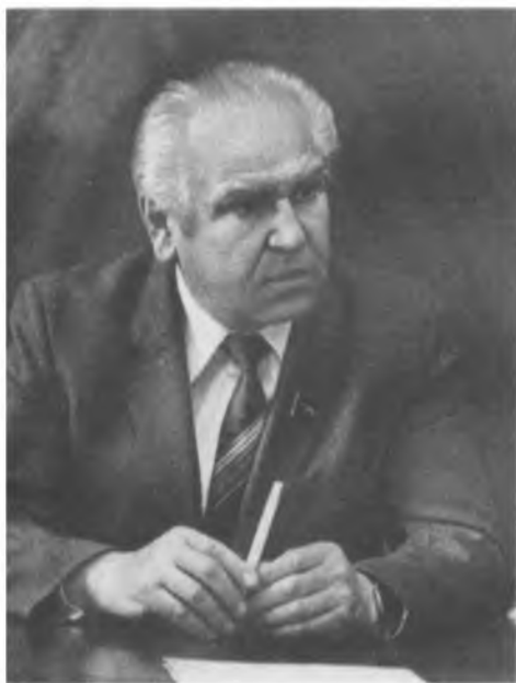
СЛЮНЬКОВ Николай Никитович

Член Политбюро ЦК КПСС, секретарь ЦК КПСС. Родился 26 апреля 1929 года в местечке Городец Рогачевского района Гомельской области Белорус. В 1950 году окончил Минский автомеханический техникум, в 1962 году — Белорусский институт механизации сельского хозяйства. Член КПСС с 1954 года.