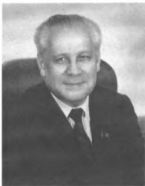
ЛУКЬЯНОВ Анатолий Иванович

Кандидат в члены Политбюро ЦК КПСС, первый заместитель Председателя Президиума Верховного Совета СССР. Родился 7 мая 1930 года в городе Смоленске. Русский. В 1953 году окончил Московский государственный университет имени М. В. Ломоносова. Доктор юридических наук. Член КПСС с 1955 года.