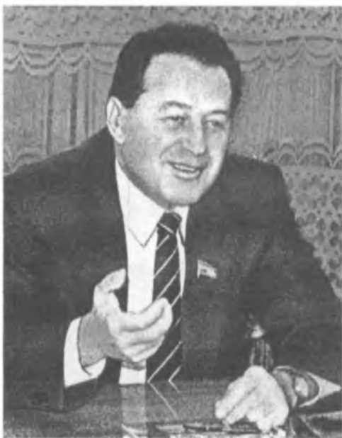
РАЗУМОВСКИЙ Георгий Петрович

Кандидат в члены Политбюро ЦК КПСС, секретарь ЦК КПСС. Родился 19 января 1936 года в городе Краснодаре. Русский. В 1958 году окончил Кубанский сельскохозяйственный институт. Член КПСС с 1961 года.