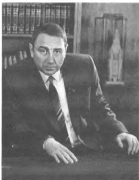
БАКЛАНОВ Олег Дмитриевич

Секретарь ЦК КПСС. Родился 17 марта 1932 года в городе Харькове. Украинец. В 1958 году окончил Всесоюзный заочный энергетический институт. Кандидат технических наук. Член КПСС с 1953 года.