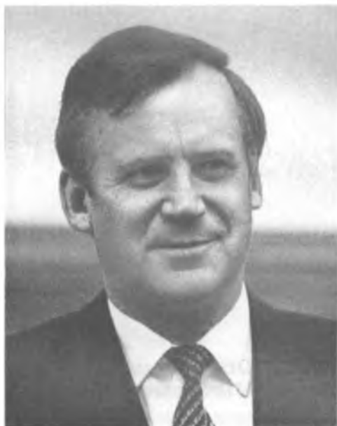
РЫЖКОВ Николай Иванович

Член Политбюро ЦК КПСС, Председатель Совета Министров СССР. Родился 28 сентября 1929 года в селе Дылеевка Дзержинского района Донецкой области. Русский. В 1950 году окончил Краматорский машиностроительный техникум, в 1959 году — Уральский политехнический институт имени С. М. Кирова. Член КПСС с 1956 года.