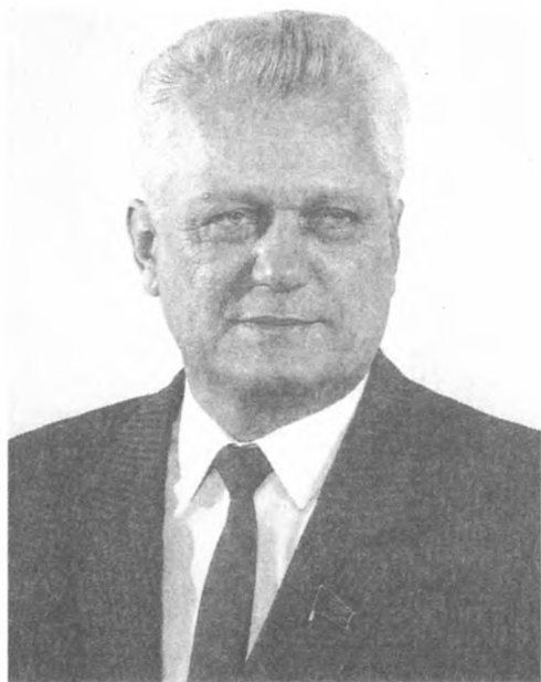
ГИРЕНКО Андрей Николаевич

Секретарь ЦК КПСС. Родился 16 марта 1936 года в городе Кривой Рог в семье рабочего. Украинец. В 1958 году окончил Криворожский горно-рудный институт, в 1971 году Заочную высшую партийную школу при ЦК КПСС. Член КПСС с 1963 года.