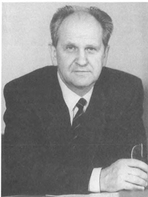
ПУГО Борис Карлович

Кандидат в члены Политбюро ЦК КПСС, Председатель Комитета партийного контроля при ЦК КПСС. Родился 19 февраля 1937 года в городе Калинин в семье партийного работника. Латыш. В 1960 году окончил Рижский политехнический институт. Член КПСС с 1963 года.