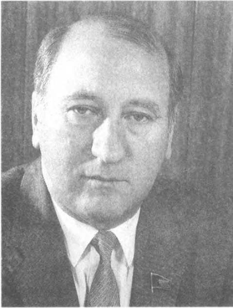
МАНАЕНКОВ Юрий Алексеевич

Секретарь ЦК КПСС. Родился 2 августа 1936 года в деревне Новопокровка Сосновского района Тамбовской области в семье колхозника. Русский. В 1964 году окончил Мичуринский плодовоовощной институт им. И. В. Мичурина, в 1974 году Заочную высшую партийную школу при ЦК КПСС. Член КПСС с 1960 года.