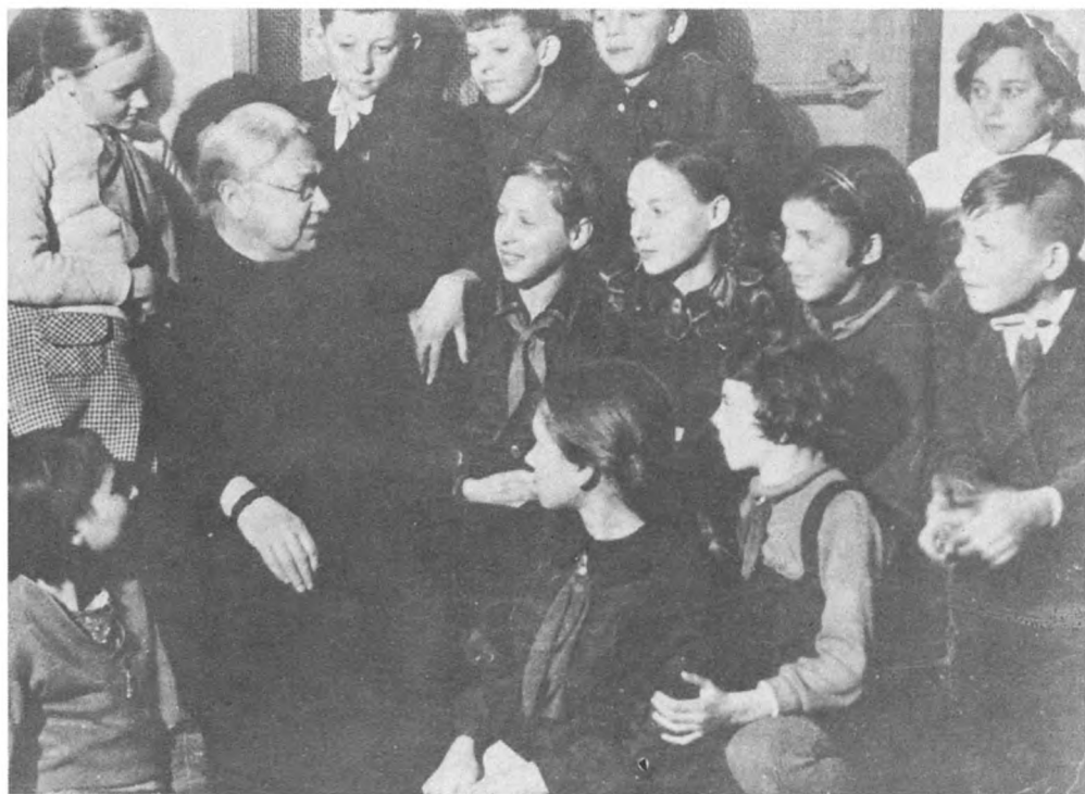
Н. К. Крупская с пионерами Москвы. Фото 1936 г.