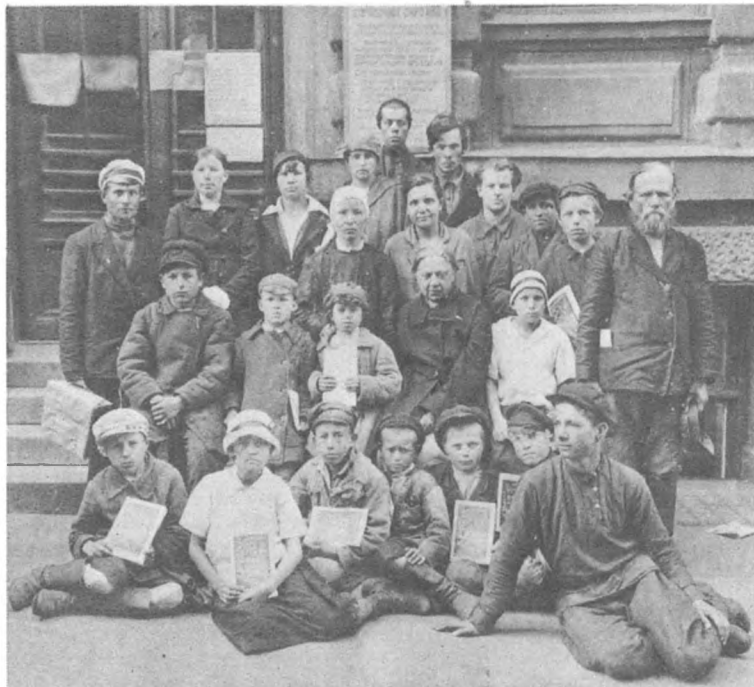
Н. К. Крупская с группой учащихся и учителей школ Костромской губернии, приехавших на экскурсию в Москву. Фото 1920 или 1921 г.