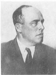
Викторов М. В. (1892—1938) Флагман флота 1 ранга