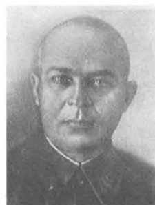
Ястребов Г. Г. (1884—1957) Корпусный комиссар