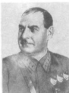
Кулик Г. И. (1890—1950) Комкор