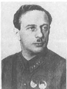
Иппо Б. М. (1898—1937) Армейский комиссар 2 ранга