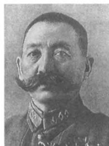
Городовиков О. И. (1879—1960) Комкор