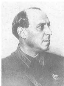
Фельдман Б. М. (1890—1937) Комкор