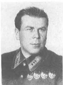
Лалин А. Я. (1899—1937) Комкор