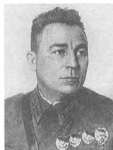
Кут'яков И. С. (1897—1938) Комкор