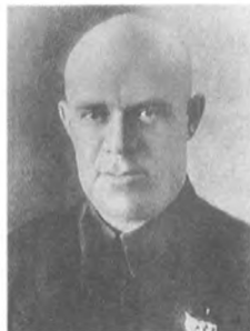
Синявский Н. М. (1891—1938) Коринженер