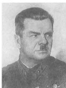
Василенко М. И. (1888—1937) Комкор