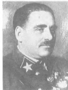
Блюхер В. К. (1890—1938) Маршал Советского Союза