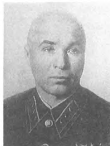
Аланасенко И. Р. (1890—1943) Комкор