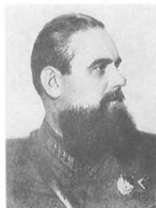
Дубовой И. Н. (1896—1938) Командарм 2 ранга