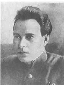
Окунев Г. С. (1900—1938) Армейский комиссар 2 ранга