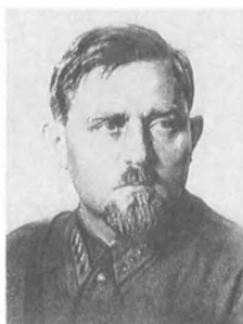
Белов И. П. (1893—1938) Командарм 1 ранга