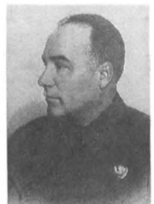
Мезис А. И. (1894—1938) Армейский комиссар 2 ранга