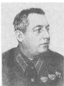
Грибов С. Е. (1895—1938) Комкор