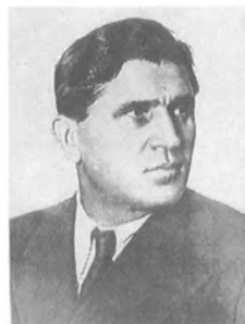
Ткачев И. Ф. (1896—1938) Комкор