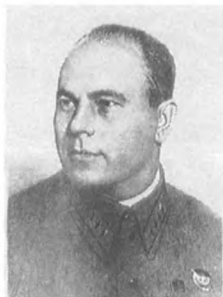
Амелин М. П. (1896—1937) Армейский комиссар 2 ранга