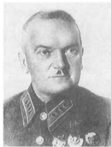
Левандовский М. К. (1890—1938) Командарм 2 ранга