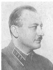
Урицкий С. П. (1895—1938) Комкор