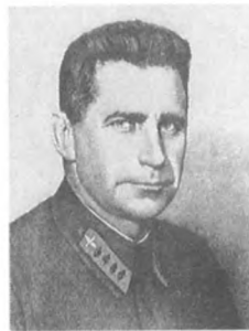
Алксис Я. И. (1896—1938) Командарм 2 ранга