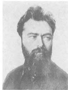
Гамарник Я. Б. (1894—1937) Заместитель народного комиссара обороны, армейский комиссар 1 ранга