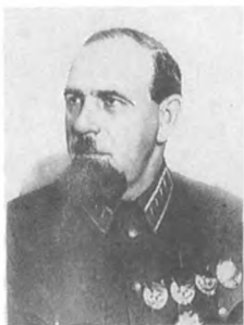
Дыбенко П. Е. (1889—1938) Командарм 2 ранга