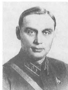
Роговский Н. М. (1897—1937) Комдив