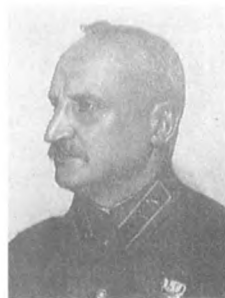
Петин Н. Н. (1876—1937) Комкор