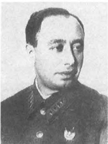
Шифрес А. Л. (1898—1938) Армейский комиссар 2 ранга