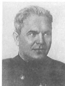
Гришин А. С. (1891—1937) Армейский комиссар 2 ранга