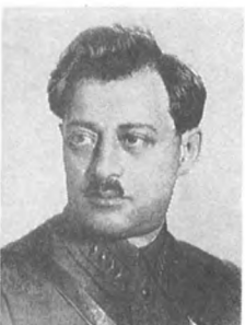
Славин И. Е. (1893—1938) Армейский комиссар 2 ранга