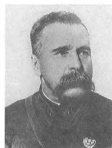
Гарькавый И. И. (1888—1937) Комкор