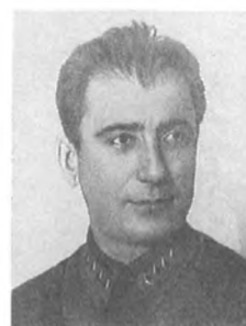
Осепян Г. А. (1891—1937) Армейский комиссар 2 ранга