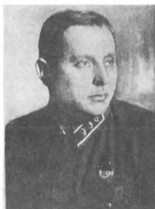
Аплого Э. Ф. (1898—1937) Комкор