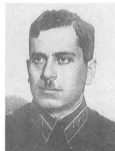
Штерн Г. М. (1900—1941) Комдив