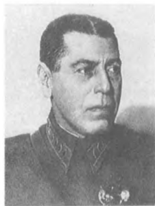
Шапошников Б. М. (1882—1945) Командарм 1 ранга