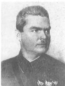
Эйдеман Р. П. (1895—1937) Комкор