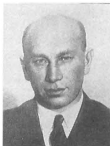
Кожанов И. К. (1897—1938) Флагман флота 2 ранга