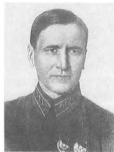
Седукин А. И. (1893—1938) Командарм 2 ранга