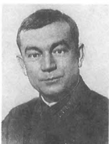
Векличев Г. И. (1898—1938) Армейский комиссар 2 ранга