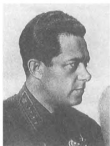
Якир И. Э. (1896—1937) Командарм 1 ранга