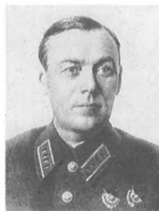
Каширин Н. Д. (1888—1938) Командарм 2 ранга