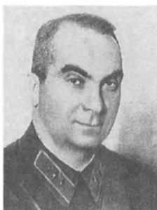
Ефимов Н. А. (1897—1937) Комкор