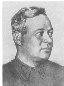
Горбачев Б. С. (1892—1937) Комкор 4