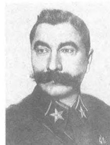
Буденный С. М. (1883—1973) Маршал Советского Союза