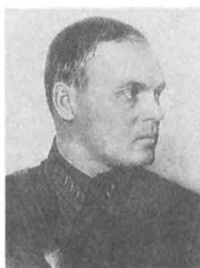
Грязнов И. К. (1897—1938) Комкор