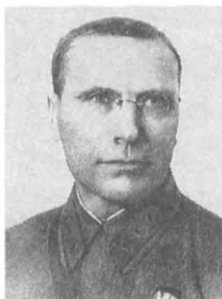
Гайлит Я. П. (1894—1938) Комкор