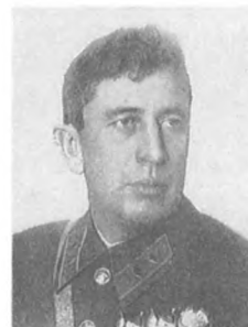
Казанский Е. С. (1896—1937) Комдив