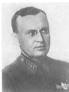
Уборевич И. П. (1896—1937) Командарм 1 ранга