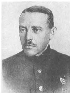
Галер Л. М. (1883—1950) Флагман флота 2 ранга