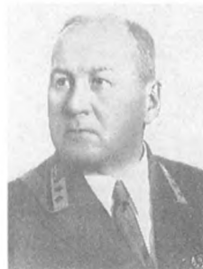
Тодоровский А. И. (1894—1965) Комкор