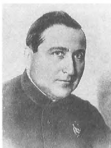
Гугин Г. И. (1896—1937) Армейский комиссар 2 ранга