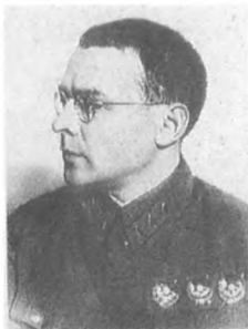
Примаков В. М. (1897—1937) Комкор