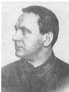
Булин А. С. (1894—1938) Армейский комиссар 2 ранга