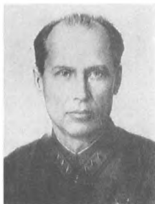
Шестаков В. Н. (1893—1938) Корпусный комиссар