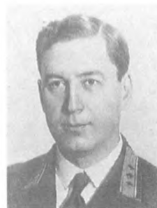
Хрипин В. В. (1893—1938) Комкор