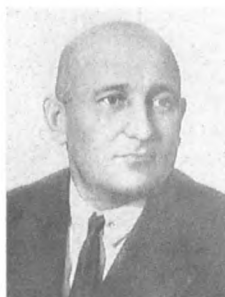
Лудри И. М. (1895—1937) Флагман 1 ранга