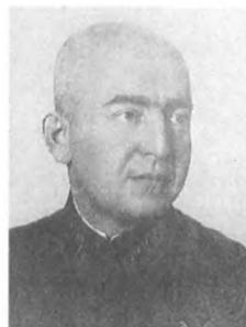
Аронштам Л. Н. (1896—1938) Армейский комиссар 2 ранга