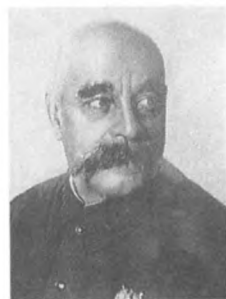
Каменев С. С. (1881—1936) Командарм 1 ранга