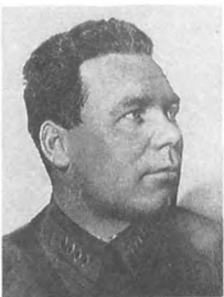
Смирнов П. А. (1897—1939) Армейский комиссар 2 ранга