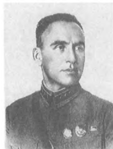
Халепский И. А. (1893—1938) Командарм 2 ранга