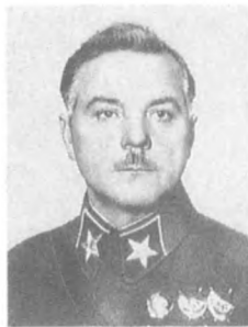
Ворошилов К. Е. (1881—1969) Народный комиссар обороны, Маршал Советского Союза

Трагична судьба большинства членов совета, которые стали жертвами незаконных репрессий, имевших место в период 30—40-х гг. Все они впоследствии реабилитированы 3 .