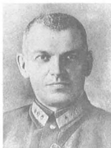
Берзин Я. К. (1890—1938) Корпусный комиссар