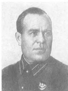
Левичев В. Н. (1891—1937) Комкор