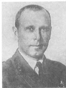
Германович М. Я. (1895—1937) Комкор