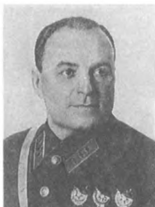
Ковтюх Е. И. (1890—1938) Комкор