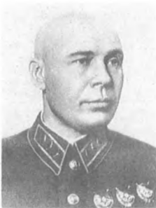
Тимошенко С. К. (1895—1970) Комкор