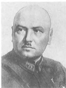
Федько И. Ф. (1897—1939) Командарм 2 ранга