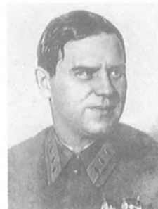
Прокофьев А. П. (1896—1939) Корпусный комиссар