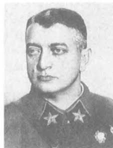
Тухачевский М. Н. (1893—1937) Заместитель народного комиссара обороны, Маршал Советского Союза