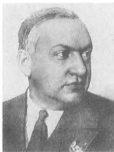
Орлов В. М. (1895—1938) Флагман флота 1 ранга