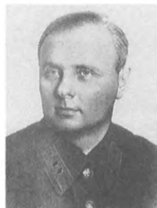
Мерецков К. А. (1897—1968) Комдив