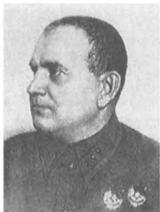
Хурлев А. В. (1892—1962) Корпусный комиссар