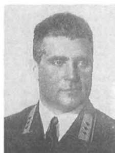
Ингаунис Ф. А. (1894—1938) Комкор