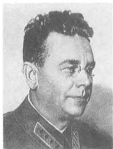
Корк А. И. (1887—1937) Командарм 2 ранга