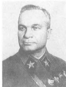
Егоров А. И. (1883—1939) Начальник Генерального штаба РККА, Маршал Советского Союза